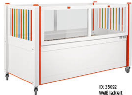
ID: 35092 Weiß lackiert