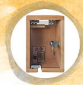
Abschließbare Handschalter-Box (für alle Betten erhältlich)