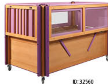
ID: 32560 mit Kantenpolsterung