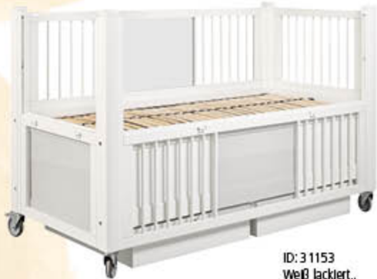
ID: 31153 Weiß lackiert, zwei Schubkästen, teils Lexan, teils Stäbe