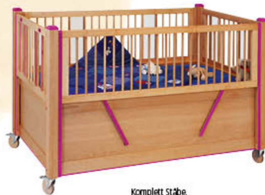
Komplett Stäbe, z. B. mit elektrisch absenkbarem Seitengitter, Im Farbakzent Purpur