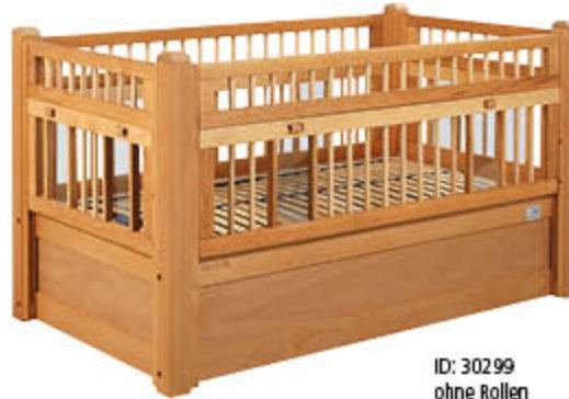
ID: 30299 ohne Rollen