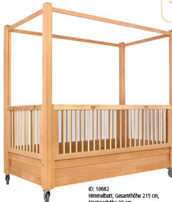
ID: 10682 Himmelbett, Gesamthöhe 215 cm, Einstiegshöhe 30 cm