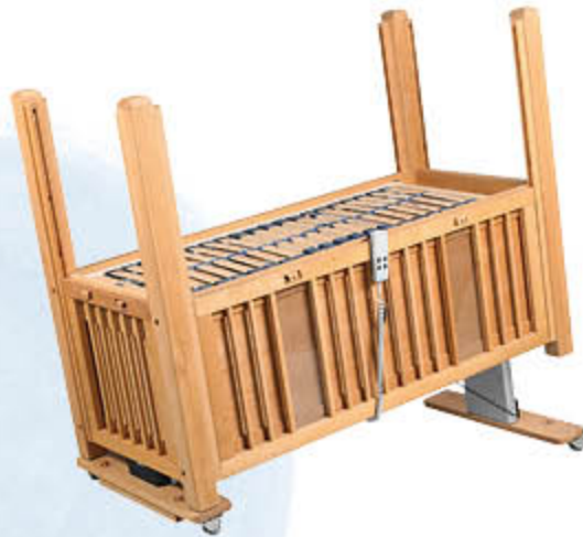
ID: 35165 Holzton „Barrique“, elektrisch absenkbares Seitengitter