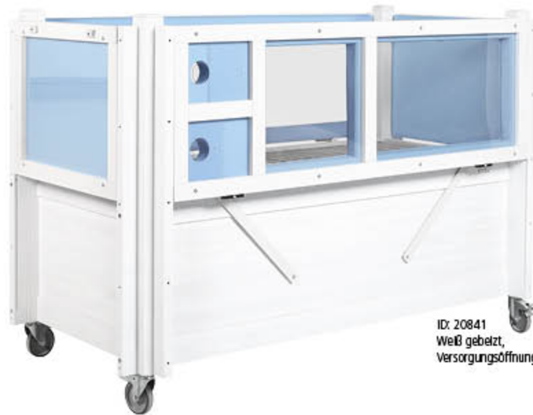
ID: 20841 Weiß gebeizt, Versorgungsöffnung (Loch)