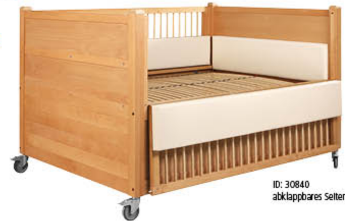
ID: 30840 abklappbares Seitengitter