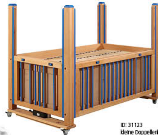
ID: 31123 kleine Doppellenkrollen, blaue Stäbe