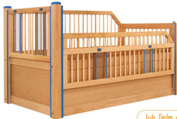
ID: 10394 Anpassung an eine Dachschräge