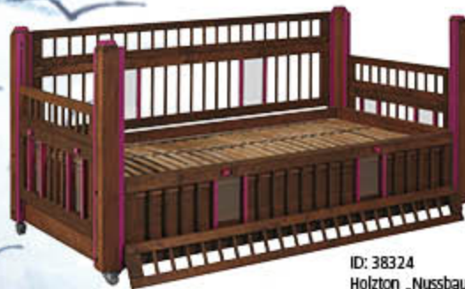
ID: 38324 Holzton „Nussbaum“