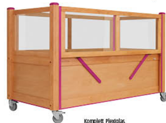
Komplett Plexiglas, z. B. mit elektrisch absenkbarem Längsseitengitter, Im Farbakzent Purpur