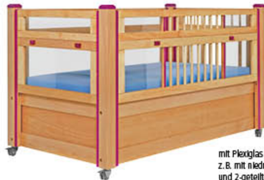
mit Plexiglas + Stäben, z. B. mit niedrigem Einstieg (47 - 87 cm) und 2-geteiltem Gitter (40 + 20 cm Aufsteckgitter)