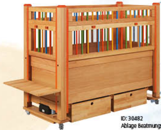
ID: 30482 Ablage Beatmungsgerät