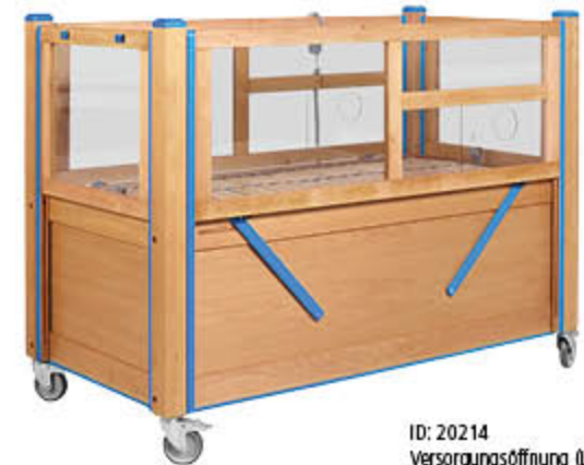
ID: 20214 Versorgungsöffnung (Loch) mit Verschlussmechanismus