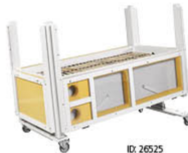
ID: 26525 mit Trendelenburgfunktion, Versorgungsöffnung (Loch)