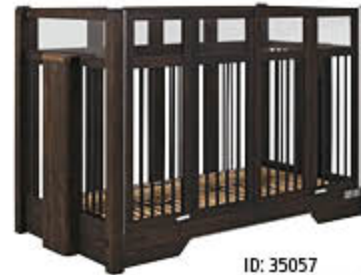
ID: 35057 niedriger Einstieg (ohne Rollen), Holzton „Basalt“