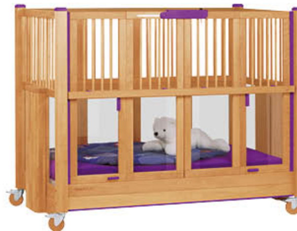
Seitengitterhöhe 135 cm, z. B. Im Farbakzent Blau-Lila mit Holzrollen