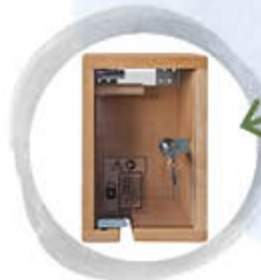
Abschließbare Handschalter-Box (für alle Betten erhältlich)