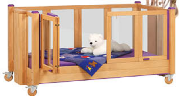
Seitengitterhöhe 72 cm, z. B. Im Farbakzent Blau-Lila mit Holzrollen

Viel Sicherheit, auch für besonders aktive Kinder