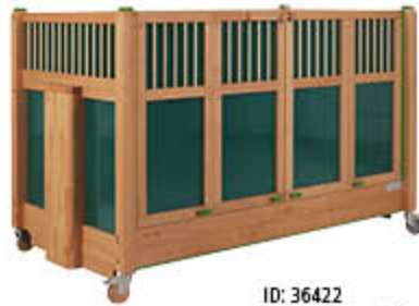
ID: 36422 Kindername auf der Bettseite, fest integrierte Polsterung (Material: LKW-Plane)