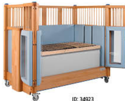
ID: 34923 Eingriffschutz für die Höhenverstellung

„Sooo viel Platz – da würde ich mich auch gern hineinkuscheln!“