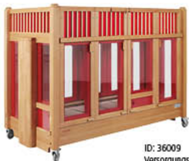
ID: 36009 Versorgungsöffnung (Loch) mit Verschleißmechanismus

Die integrierten Vinyl-Fenster fügen sich flächenbündig in die fest integrierte Skai-Polsterung ein und bieten somit eine ähnliche Polsterwirkung wie die fest integrierte Schaumstoffpolsterung. Die Fenster bieten den optimalen Durchblick. So haben Sie Ihr Kind besser im Auge und Ihr Kind fühlt sich sichtlich wohler.