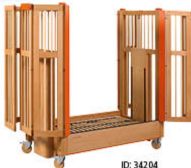
ID: 34204 komplett Stäbe, Holzräder, beidseitig 270° Tür