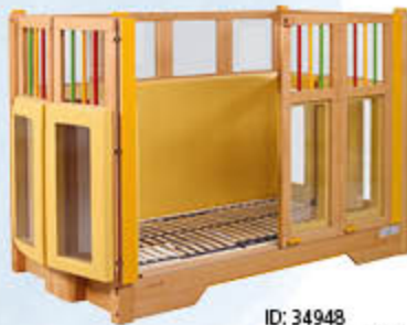
ID: 34948 ohne Rollen, bunte Stäbe