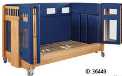
ID: 36449 Versorgungsöffnung (Loch) mit Verschleißmechanismus