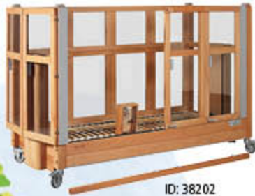
ID: 38202 Farbakzent Grau, abschließbare Handschalter-Box, externe Verriegelung