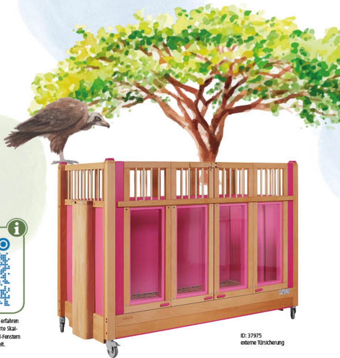
ID: 37975 externe Türsicherung

Scannen Sie den QR-Code und erfahren mehr über unsere fest integrierte Skai-Polsterung mit integrierten Vinyl-Fenstern und deren Polsterfähigkeit.