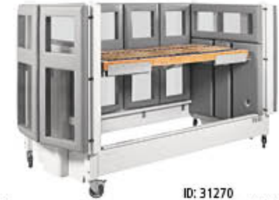
ID: 31270 Weiß lackiert (deckend)