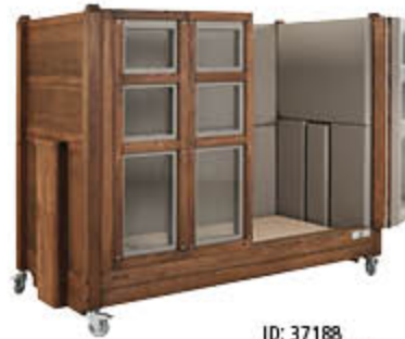
ID: 37188 Trittschutz für den Lattenrahmen, Holzton „Nussbaum“