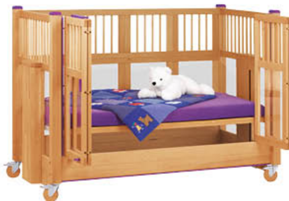
Seitengitterhöhe 113 cm, z. B. Im Farbakzent Blau-Lila mit Holzrollen