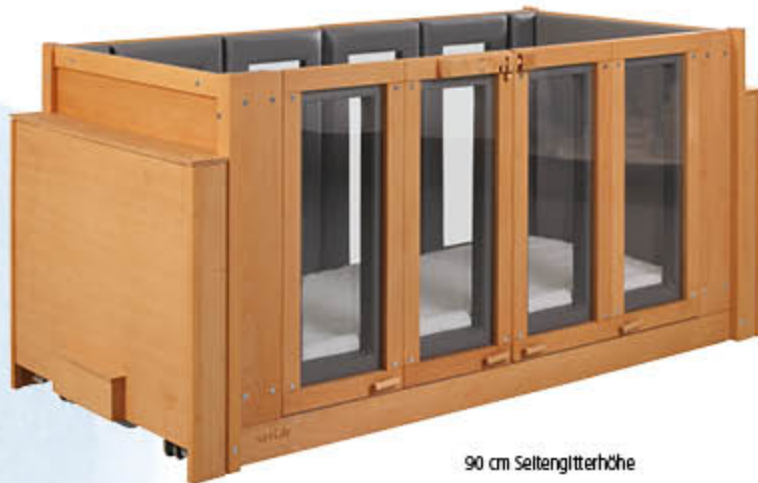
90 cm Seitengitterhöhe

Die integrierten Vinyl-Fenster fügen sich flächenbündig in die fest integrierte Skai-Polsterung ein und bieten somit eine ähnliche Polsterwirkung wie die fest integrierte Schaumstoffpolsterung. Die Fenster bieten den optimalen Durchblick. So haben Sie Ihr Kind besser im Auge und Ihr Kind fühlt sich sichtbar wohler.